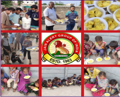
ઘાંગઘા ગ્રુપ દ્વારા નાના ભૂલકાઓને ભેળ તથા ખમણનું વિતરણ