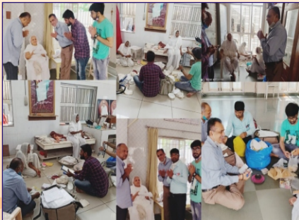
રાજકોટ ગ્રુપ દ્વારા ચોમાસા પહેલાં સાધુ-સાધ્વીજી ભગવંતોની વૈયાવચ્ચ