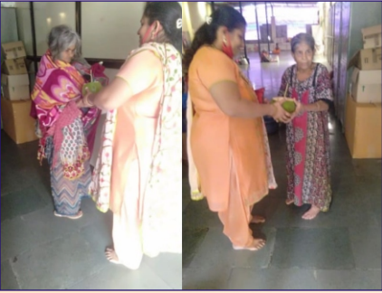
વિરાર ગ્રુપ દ્વારા વૃદ્ધાશ્રમમાં જઈ નાળીયેરના પાણીનું વિતરણ