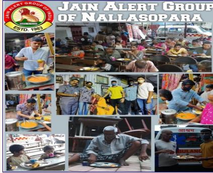
નાલાસોપારા ગ્રુપ દ્વારા વૃદ્ધાશ્રમમાં જઈ અનાજનું વિતરણ