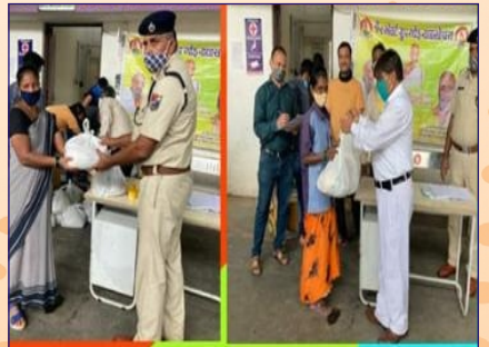
નાલાસોપારા ગ્રુપ દ્વારા ફરજ બજાવતા પોલીસ, સફાઈકર્મી કરોને અનાજની કીટનું વિતરણ