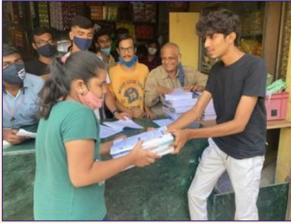
નાલાસોપારા ગ્રુપ દ્વારા બાળકોમાં નોટબુકનું વિતરણ