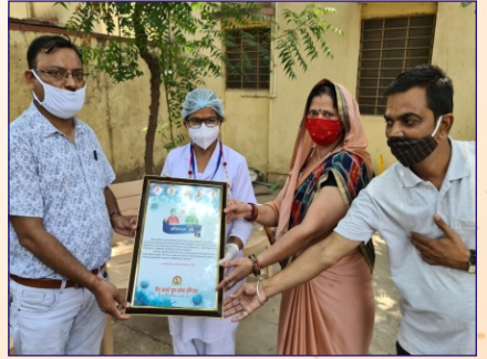
દીંડોનસીટી ગ્રુપ દ્વારા કોરોનામાં ફરજ બજાવતા ડોક્ટરનું બહુમાન