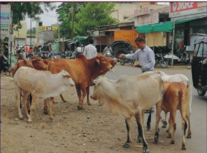
ખામગાંવ ગ્રુપ દ્વારા ગાય તથા કૂતરાને રોટલી-બીસ્કીટનું વિતરણ