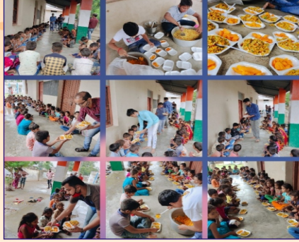
ડભોઈ ગ્રુપ દ્વારા નાના ભૂલકાઓને ભેળ તથા કેરીનું વિતરણ