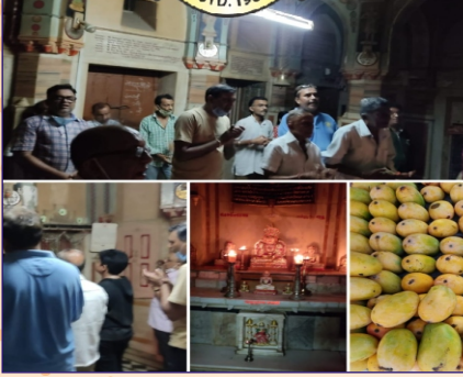
આમોદ ગ્રુપ દ્વારા આ.શ્રી દેમરનસૂરીશ્વર મ.ની પરમી દીક્ષાતીથી નિમિત્તે આરતી, અનુકંપાદાન, સામાયિક