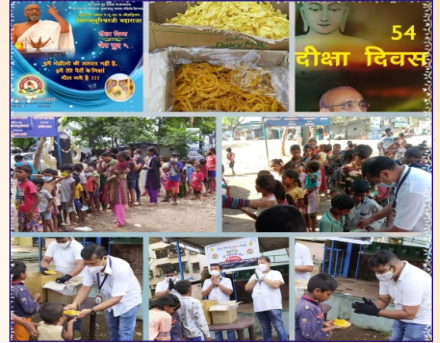
વસઈ ગ્રુપ દ્વારા નાના ભૂલકાઓમાં ફાફડા-જલેબીનું વિતરણ