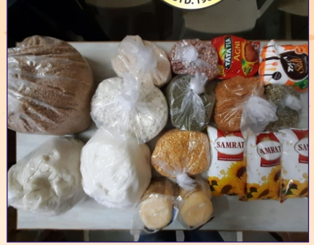
દહીસર ગ્રુપ દ્વારા અનાજની કીટનું વિતરણ